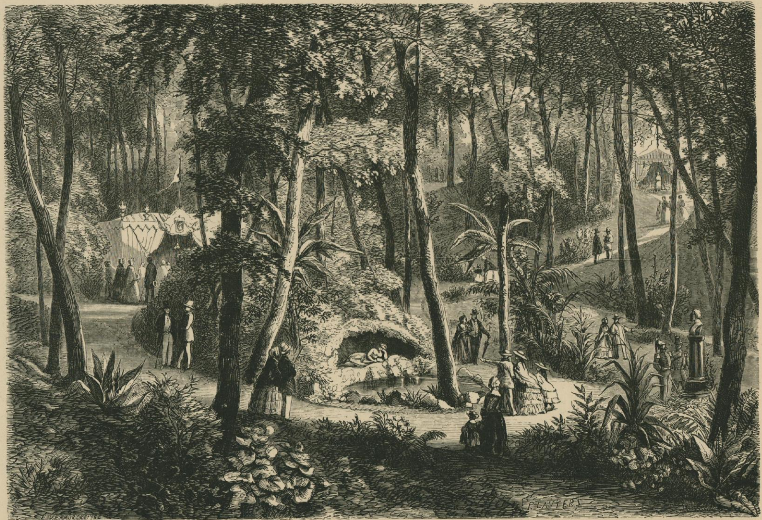
FÊTES CÉLÉBRÉES A L'OCCASION DU XXV e ANNIVERSAIRE DE L'INAUGURATION DE LÉOPOLD I er . Exposition de la Société de Flore dans le bois de Marie-Madeleine (bas-fonds du Parc).